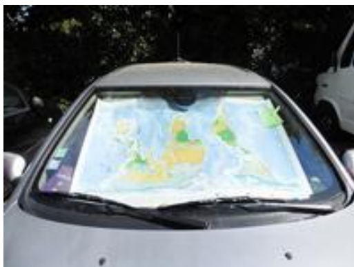
Claire : la planisphère est un excellent pare-soleil militant !

J'invite celles et ceux qui le veulent à m'envoyer les photos des endroits les plus insolites où illes ont mis leur planisphère renversante , ou les usages les plus inattendus qu'illes leur ont trouvé ! Je fais faire une petite galerie de photos ici : http://les-volets-jaunes.org/cartes-voyageuses/